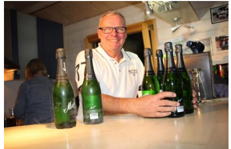
Was schmeckt besser: Sekt oder Bierbowle?